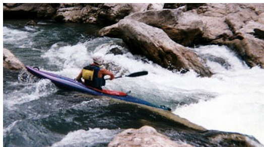
Van: Worstelen met de stroom van het leven

We kennen allemaal wel van die periodes in ons leven waarin de dingen niet zo lekker lopen. Soms zijn er kleine probleempjes, soms zelfs hele grote. Misschien voel je een onvrede in jezelf of voel jij je ontevreden omdat het niet goed gaat met je relatie, in je gezin of op je werk, of misschien lukt het je niet om een verlies te verwerken. Ook kun je verwikkeld zijn geraakt in een conflict dat maar niet tot een oplossing komt of zelfs verder dreigt te escaleren. Misschien zoek je een gids op jouw spirituele pad of loop je met de vraag rond "Wil ik dit allemaal nog wel zo?" of vraag jij je samen met Peggy Lee af: