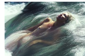
Naar: Je veilig laten dragen door de stroom van het leven

Voor mensen die de Workshop hebben gevolgd en zoeken naar verdere spirituele verdieping. (4 maandelijks avonden)